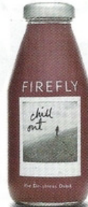
FIREFLY ZIJN BRONWATERS MET KRUIDEN EN VRUCHTEN-EXTRACTEN.